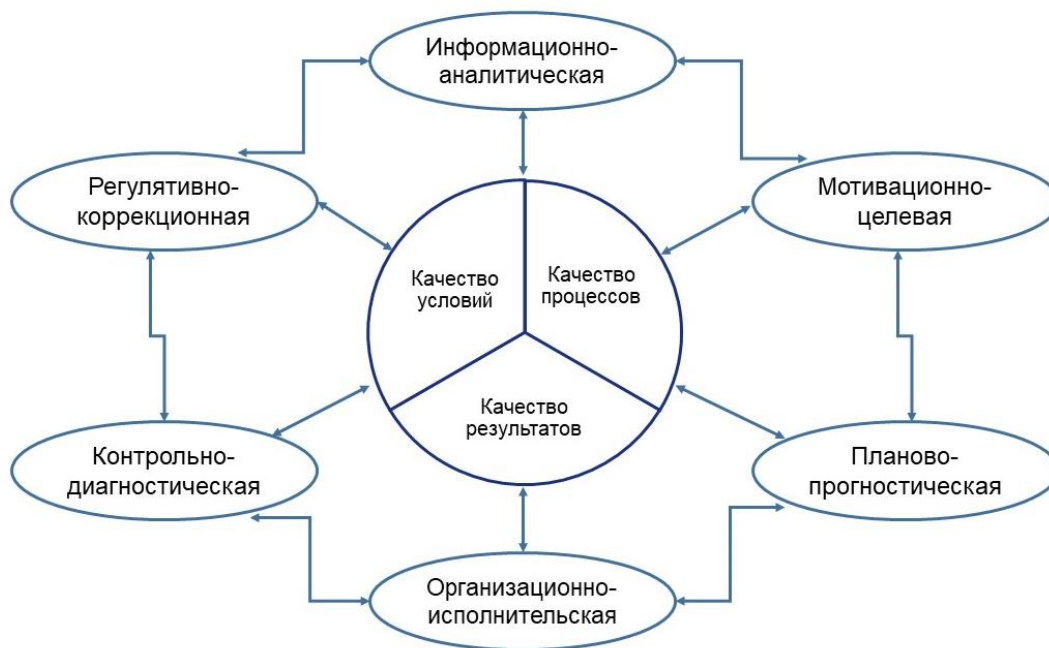
Рис.1. Система менеджмента качества образования (СМКО).

Эти функции управления образуют единый замкнутый управленческий цикл и применимы к управлению качеством образования.